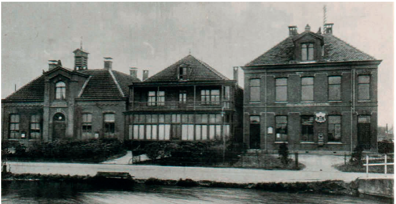
Een foto uit het begin van de vorige eeuw. Links het gemeentehuis, in het midden de burgemeesterswoning en rechts het postkantoor met boven de woning van de beheerder.