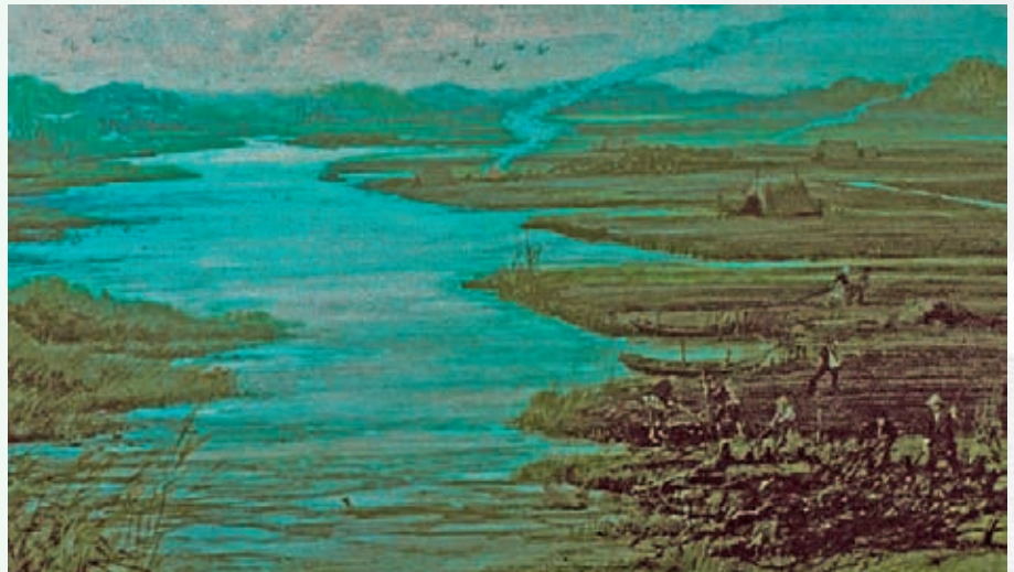
Artist impression van een veengebied en veenontginning.

appels en kersen. In 1956 ontdekte de rechtshistoricus prof.dr. Hendrik van der Linden de overeenkomsten tussen de poldergebied rond Rijnsaterwoude, Leimuiden en Woubrugge en dat van het Alte Land. De landschappelijke structuur van beide gebieden komen sterk overeen. Uit onderzoek bleek dat 900 jaar geleden Hollandse kolonisten in de middeleeuwen met hun 'moderne' ontginningsmethode het gebied zijn ingetrokken en het Alte Land hebben opengelegd. Men spreekt in Duitsland van de Hollerkolonisation : de streek die de Hollanders ontgonnen hebben.