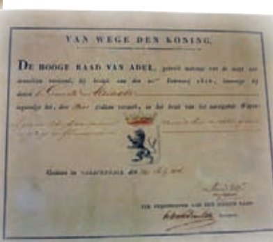
Het 'wapendiploma' van Alkemade