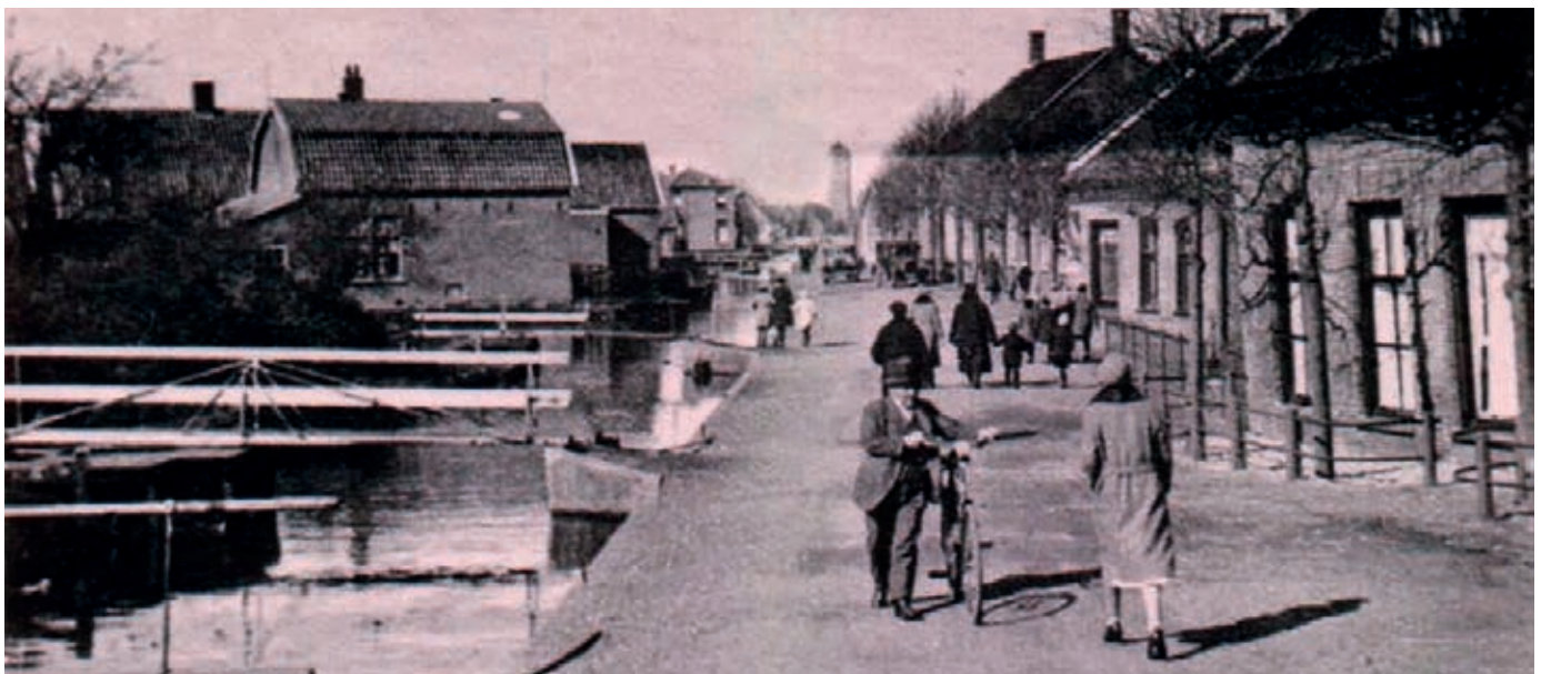
De Veenwetering in Roelofarendsveen functioneerde als riool én als drinkwatervoorziening.