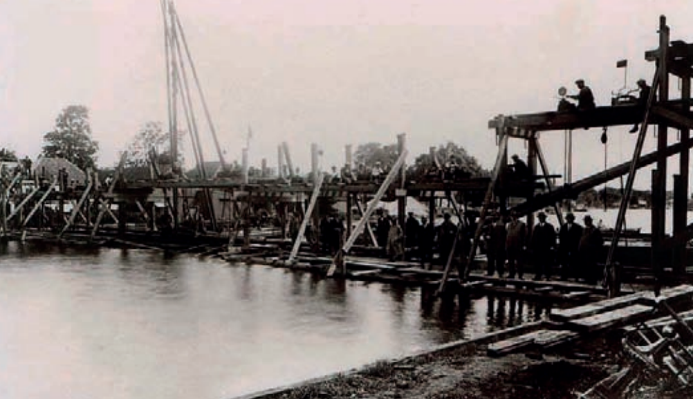
Een van de eerste werkzaamheden was het leggen van een zinker door de Rijn bij Koudekerk-Hazerswoude.

inschrijver was f 34.500.-. De laagste inschrijver was van de n.v. Beton- en Bouwbedrijf Tubantia uit Enschede met een bedrag van f 24.686.-. Aan dit bedrijf werd dan ook de opdracht verstrekt. Een bijzondere bepaling in de opdracht was, dat met uitzondering van het zgn. vakwerk slechts arbeidskrachten uit de drie gemeenten in dienst genomen mochten worden (het was crisis in de jaren dertig en er waren veel werklozen in de gemeente). Met de aanwezigheid van een groot aantal hoogwaardigheidsbekleders, waaronder de Commissaris van de Koningin, werd op 26 november 1931 de watertoren officieel in gebruik genomen.