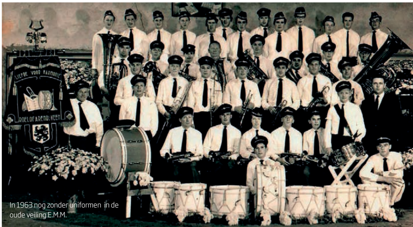
In 1963 nog zonder uniformen in de oude veiling E.M.M.

Het jubileumjaar nadert zijn einde. In deze laatste aflevering een overzicht van de activiteiten en bijzondere gelegenheden vanaf de jaren zestig.