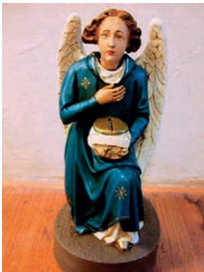
Een knikengel die met zijn hoofd 'ja' knikt als je een muntje in de spaarpot gooit..

Heerlijk speelgoed was dat. Het rook ook zo lekker want er lag echte mos in. Voor de grot was nog ruimte voor een aantal kaarsjes in van die houdertjes die op paddenstoelen leken. Op de kerstdagen werd bij ons, 's avonds als je naar