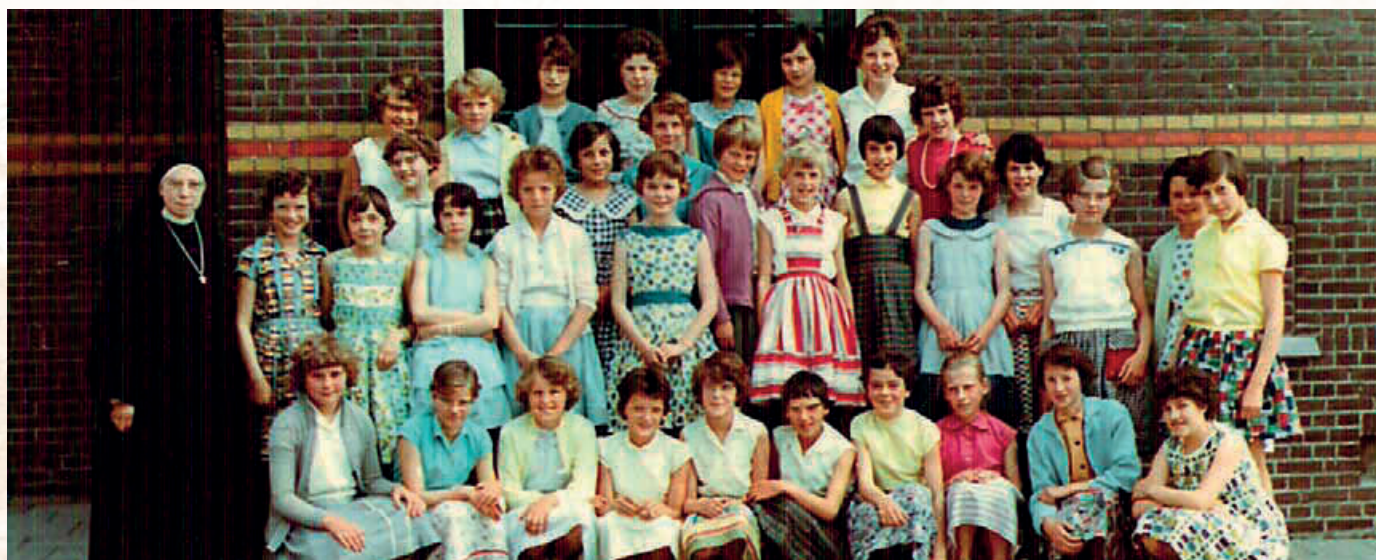
Zomer 1961 - klas 6 van de Mariaschool Roelofarendsveen.