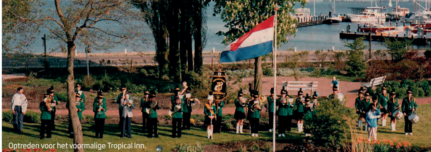
Optreden voor het voormalige Tropical Inn.