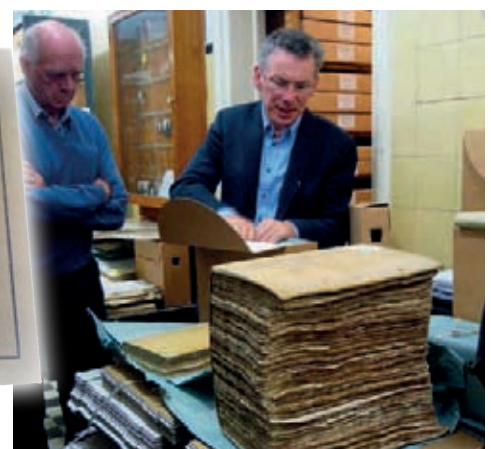
Zo'n dik boek hadden we nog nooit gezien!